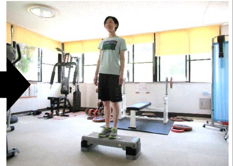
6. これを左右交互に繰り返す。台の上では両足が伸びるように意識します。