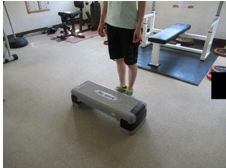
4. 左足も下ろして両足揃える