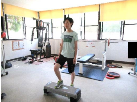
1. 踏み台の上に右足をのせる