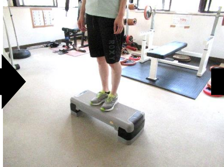
2. 左足ものせてまっすぐ立つ