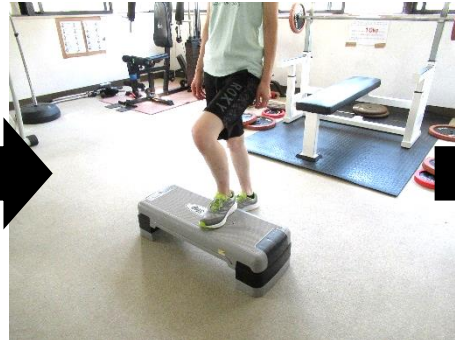
5. 最初の態勢に戻ったら、左足から踏み台にのせ、左足から下ろす。