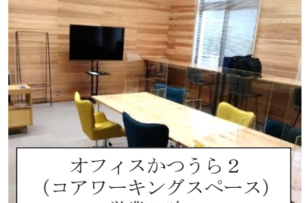
オフィスかつうら2 (コアワーキングスペース) 営業日時 (9:00~17:00 土日祝休)