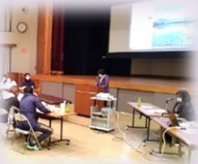
コロナ対策を講 じて開催