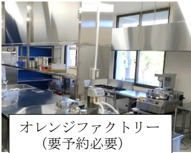
オレンジファクトリー (要予約必要)