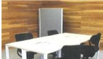
オフィスかつうら1 (お試しサテライトオフィス)