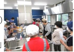
かんきつ テラス徳島